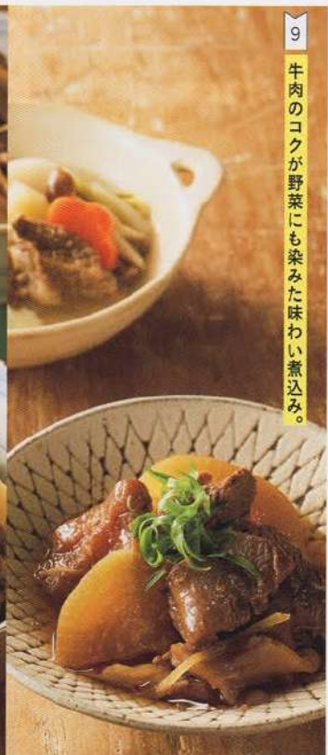
9 牛肉のコクが野菜にも染みわたる旨み。