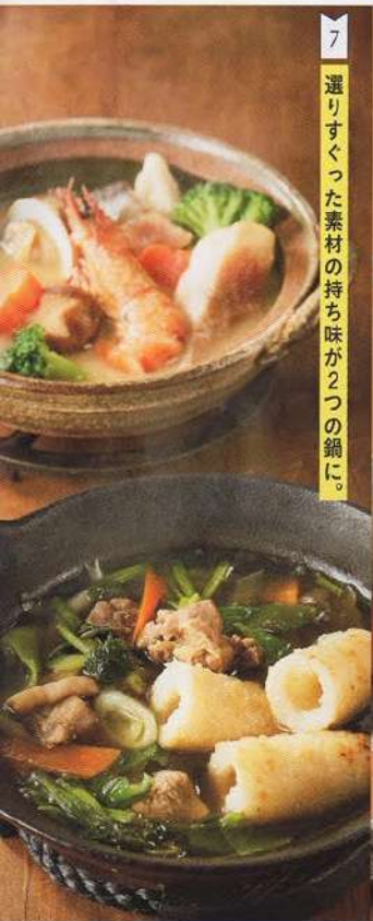
7 選りすぐった素材の持ち味が2つの鍋に。