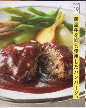
10 国産牛を100%使用したハンバーグ。