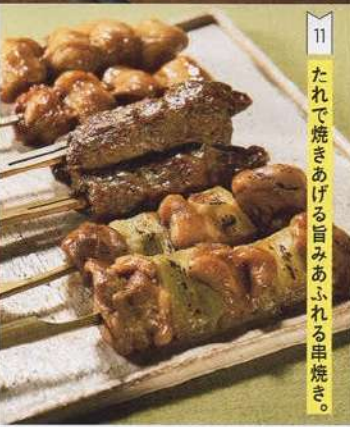
11 たれで焼きあげる旨みあふれる串焼き。