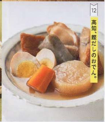
12 高知、鯉だしのおでん。

7 きりたんぼ鍋は鶏肉、きりたんぼ、舞茸などをセットに。海鮮の鍋はハマグリや野菜など、甘みのある米味噌の味わいが楽しめる鍋セットです。 冷凍便 注 品質情報 WEB 無料 〈海星〉レンジで簡単 きりたんぼと海鮮の鍋セット C 226-173 mi ..... 3,780円(本体3,500円) きりたんぼ鍋300g 海鮮鍋280g×各2